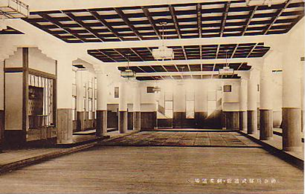
（場造柔斜・前造武縣川京勝）